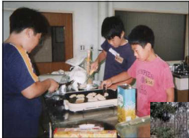
夏休み すいとん作り

水を使い回す・水を汚さない 緑を守る・育てる ごみを出さないしくみをつくる お日さまや風でエネルギーを自給 埼玉の食と農で自給をめざす