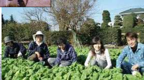
菜の花プロジェクト