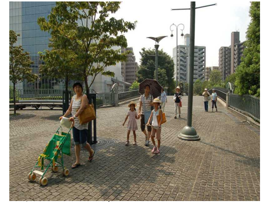
まちウォッチング

水を使い回す・水を汚さない 緑を守る・育てる ごみを出さないしくみをつくる お日さまや風でエネルギーを自給 埼玉の食と農で自給をめざす